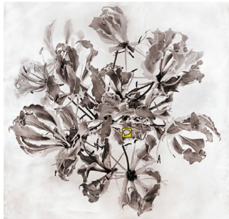
Ci-contre Aquia nem everatur moluptae inim adipsae rumqui sequam, occabo.