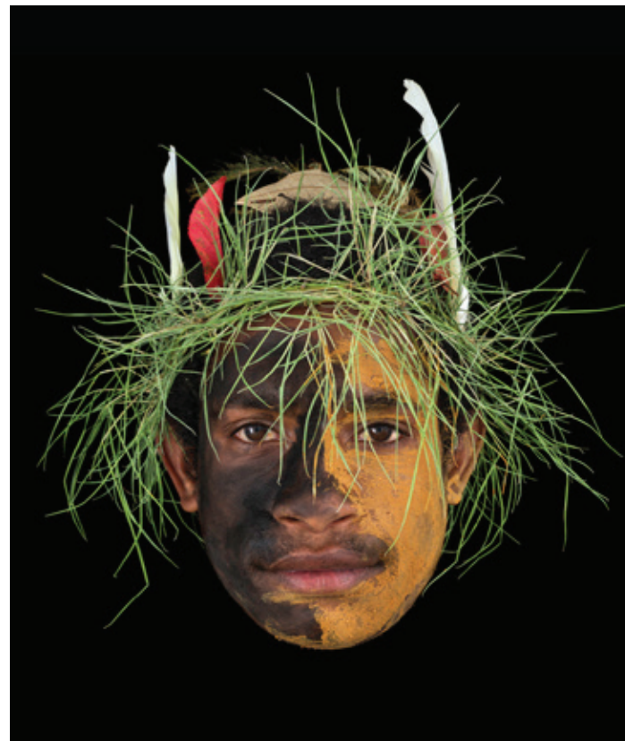
Ci-dessus Aquia nem everatur moluptae inim adipsae rumqui sequam, occabo. 2000.

Car « chez Schneck, tout est portrait. Les photographies des oliviers et des animaux autant que celles des humains ». Depuis quelque temps, Antoine Schneck explore la technique du collodion humide, inventée en 1851 et dont Nadar se servit pour la plupart de ses portraits. Il a ainsi réalisé une série sur les fleurs et les carburateurs. L'une de toutes ses dernières images est celle d'un saxophone, emprunté à un ami. Le bel objet a été capturé sous tous les angles comme pour faire advenir sa totalité, un monde en soi. Et pour nous inviter, conclut Pierre Wat, à « regarder l'autre tel qu'il est, le regarder vraiment, sans jamais chercher, par quelque moyen que ce soit,