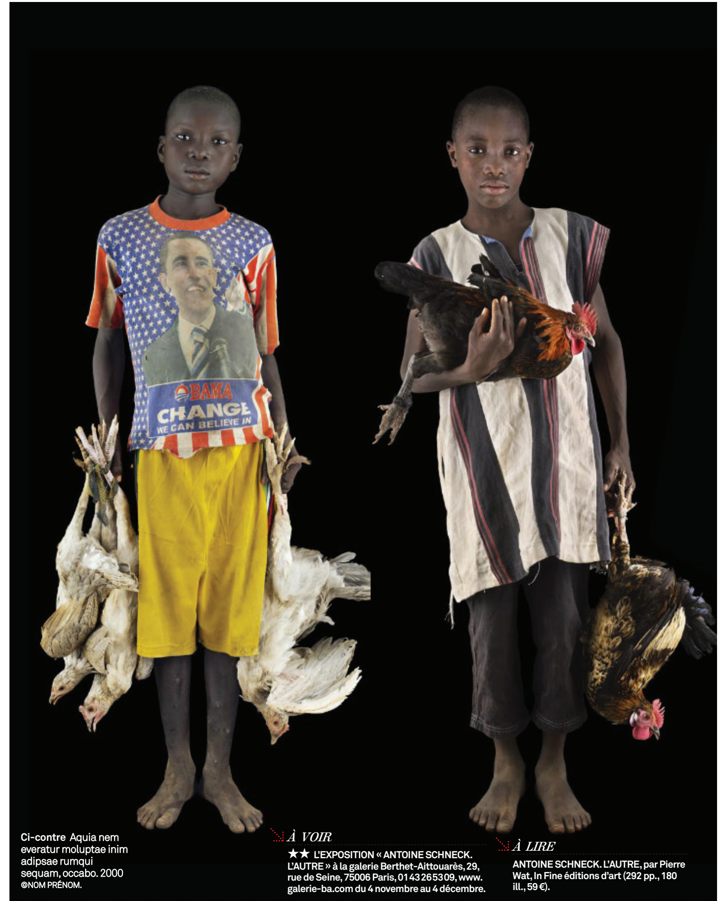
Ci-contre Aquia nem everatur moluptae inim adipsae rumqui sequam, occabo. 2000 ©NOM PRÉNOM.