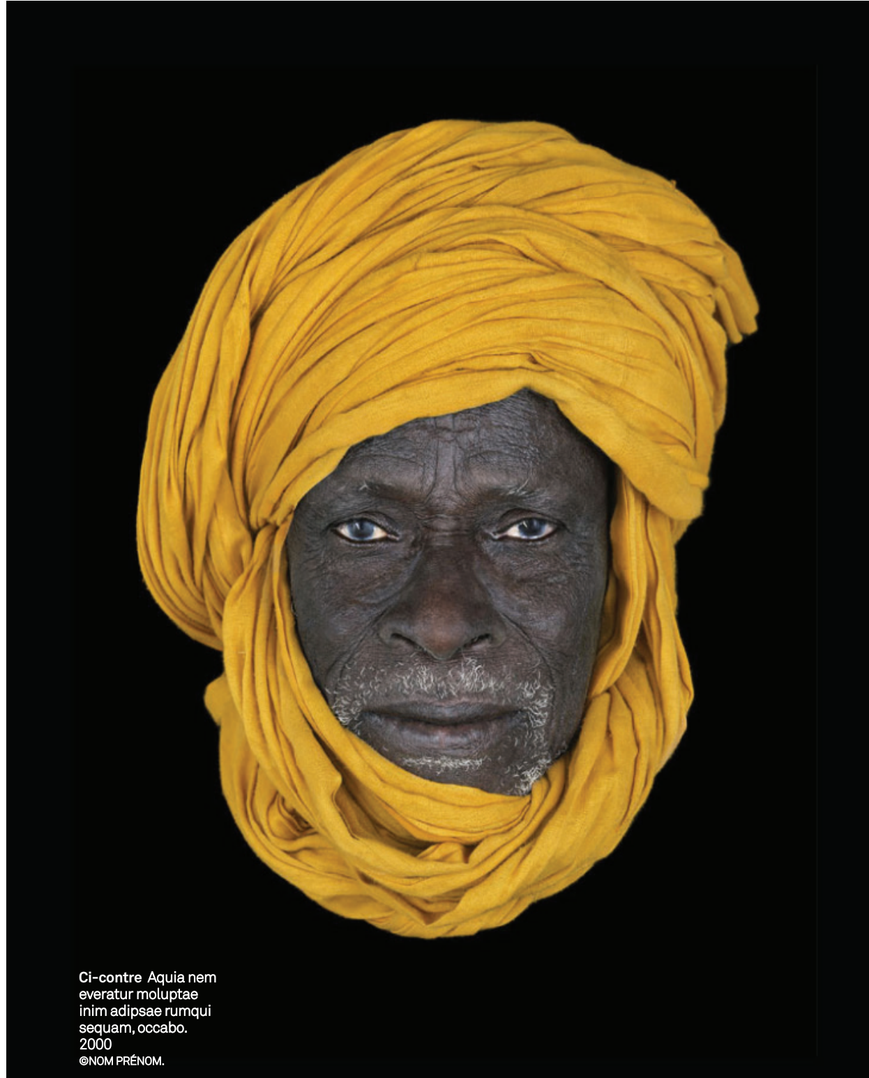
À gauche Aquia nem everatur moluptae inim adipsae rumqui sequam, occabo. 2000 ©NOM PRÉNOM.

nelle est vécue par le photographe comme « la rencontre de l'altérité ». En 2008 débute une nouvelle aventure à travers différents pays d'Afrique, en Nouvelle Guinée ou en Inde. Emportant avec lui la même recherche de qualité, d'abord à la chambre puis très rapidement avec des moyens numériques et en grand format.