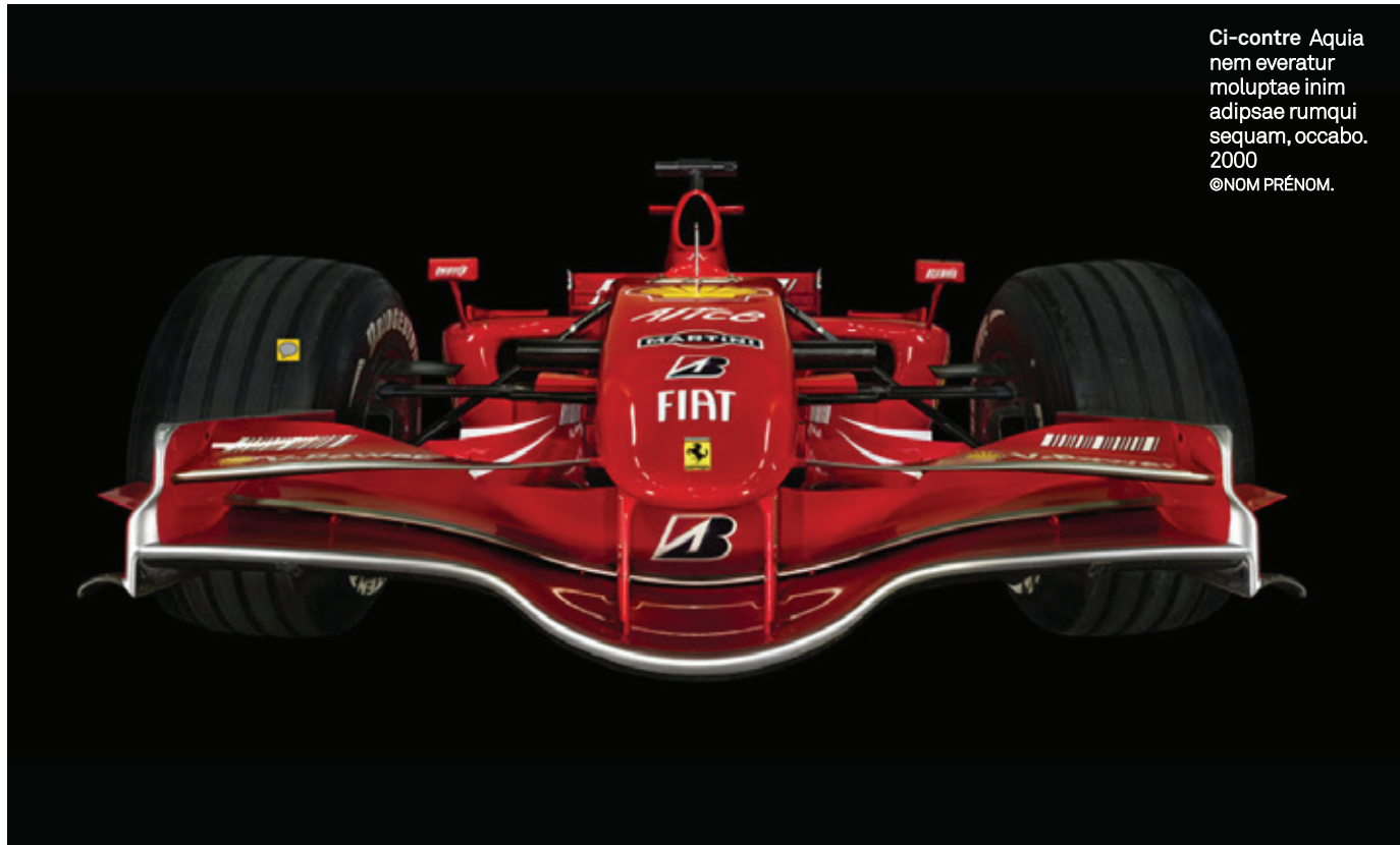
Ci-contre Aquia nem everatur moluptae inim adipsae rumqui sequam, occabo. 2000 ©NOM PRÉNOM.

cette frontière charnelle entre l'être et le fond noir, afin de faire disparaître toute impression de détournement, au profit de la texture veloutée de la peau, qu'il donne ainsi à éprouver. »